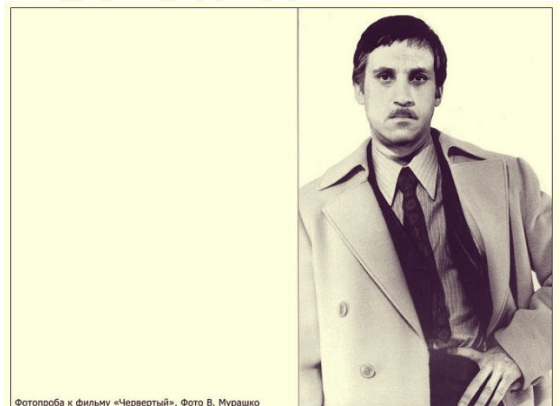
Фотопроба к фильму «Червертый».

В 1980 году Высоцкий умирает от острой сердечной недостаточности у себя в постели, во сне. В это время в Москве проходила Олимпиада, и смерть не афишировалась властями, чтобы избежать народных сборищ. Однако, несмотря на это, на похоронах Высоцкого собралась огромная толпа из тысяч людей, пришедших, чтобы почтить память любимого певца и актера.